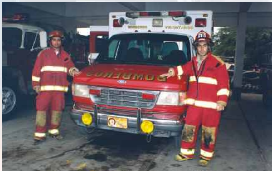
Tomando un breve descanso después de la emergencia.

Hace unos meses, un equipo de la Dirección de Imagen Institucional viajó al Sur Chico, para conocer la realidad de las Compañías de Bomberos de Lima Sur e Ica, y establecer contactos amigables con la prensa local a favor de nuestra institución.