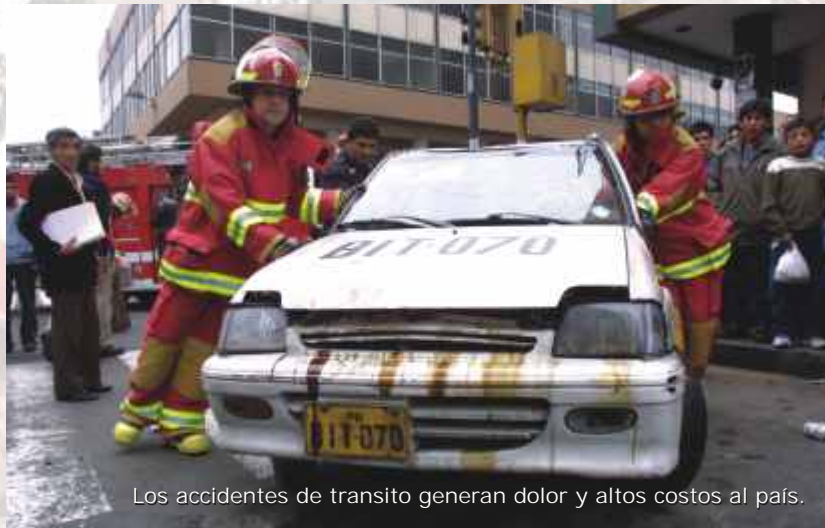
Los accidentes de tránsito generan dolor y altos costos al país.

Los países que más éxito han tenido en la reducción de daños son los que han reunido a muchas instancias distintas, desde la administración pública y la sociedad civil hasta el sector