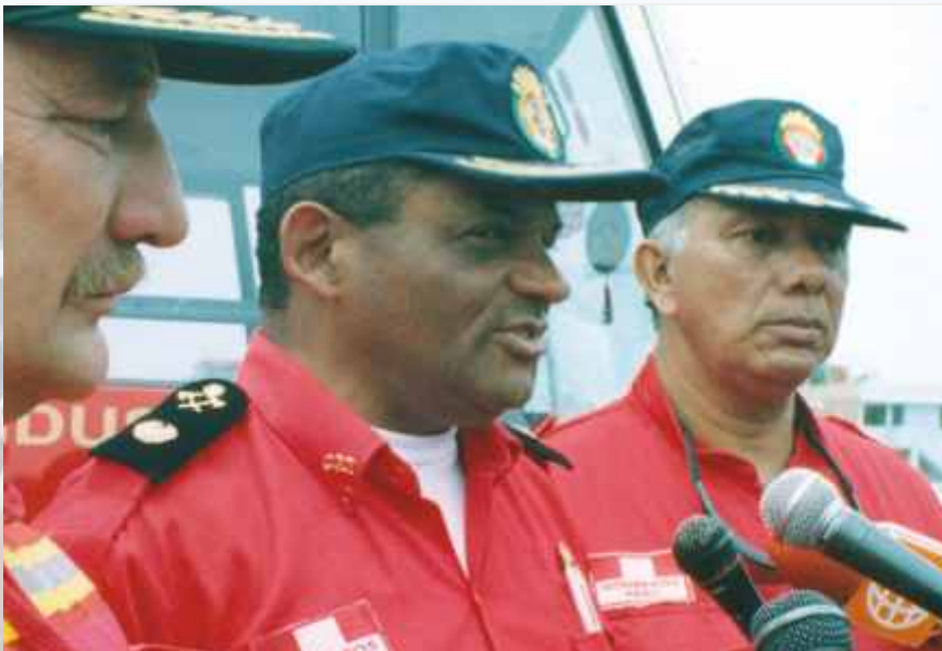
Tradición y modernidad se combinan en el bombero chalaco, dice el jefe del Callao