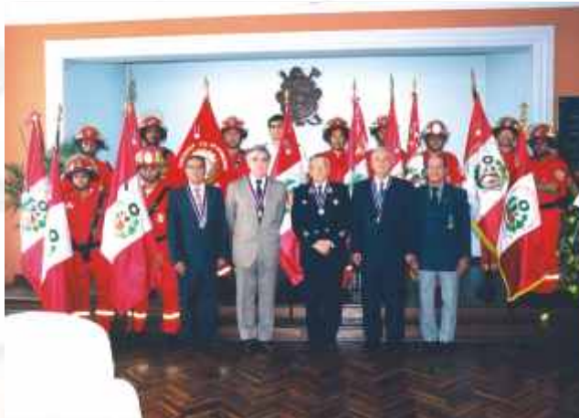
La Asociación Promarina entregó importantes condecoraciones.

El domingo 5 de diciembre, a las 9 de la mañana, el Comando Nacional se hizo presente en la