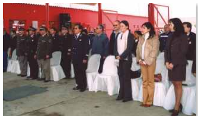
Amplio y seguro, el nuevo cuartel acoge a 22 efectivos.