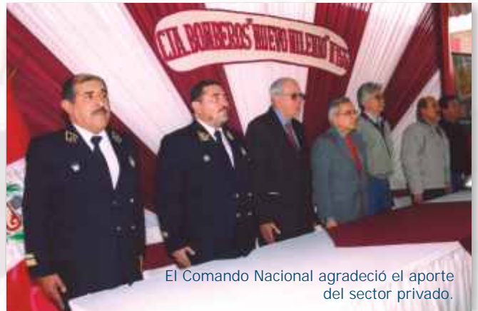
El Comando Nacional agradeció el aporte del sector privado.

La donación incluye el terreno así como la infraestructura diseñada de acuerdo a los estándares vigentes para estaciones de bomberos. El área total es de 460 metros cuadrados, incluyendo una sala de máquinas para cuatro vehículos, dormitorios, cocina, comedor, sala de estar, y aula de instrucción, entre otros ambientes.