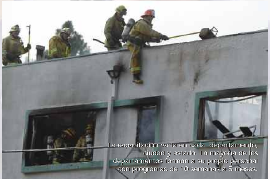
La capacitación varía en cada departamento, ciudad y estado. La mayoría de los departamentos forman a su propio personal con programas de 10 semanas a 5 meses.

Este departamento representa una formación excelente para los futuros bomberos. Es una oportunidad única para familiarizarse con el servicio y obtener una valiosa experiencia y preparación. Además de ofrecerse