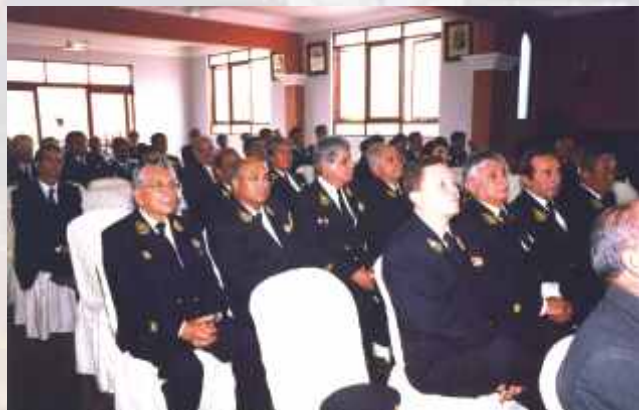
Bomberos y altas autoridades en la cita de gala.