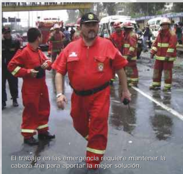
El trabajo en las emergencia requiere mantener la cabeza fría para aportar la mejor solución.

La XXIV Comandancia Departamental considera que este es el año de la reafirmación de la mística institucional y del reconocimiento del bombero como líder social. Lo afirma su máximo, abogado de profesión, quien resalta los valores como fuente de inspiración para nuestro trabajo diario.